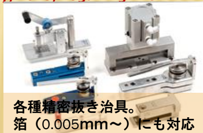
各種精密抜き治具。 箔（0.005mm～）にも対応