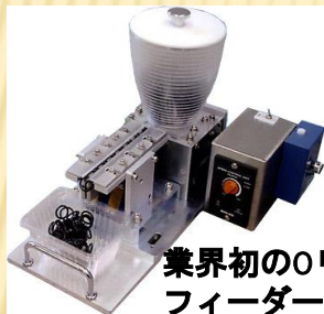
業界初のリング用 フィーダー