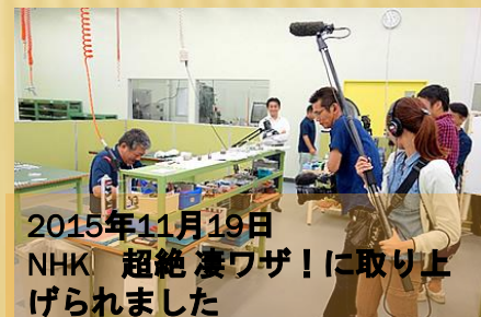
2015年11月19日 NHK「超絶凄ワザ！」に取り上げ られました