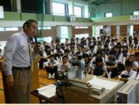
母校で講演する TMP高橋社長